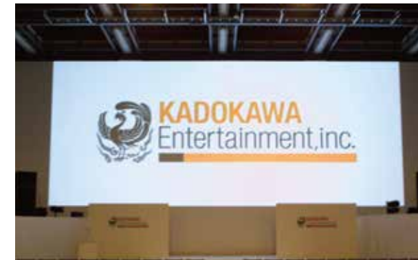
▲ 角川エンタテインメント ラインナップ発表会