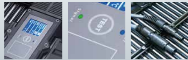
ステータスディスプレイ テストボタン コネクターB