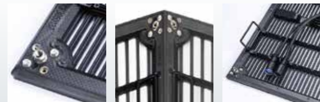
カーボンファイバーフレーム 90度の設置に対応 コネクターA&ラップケーブル